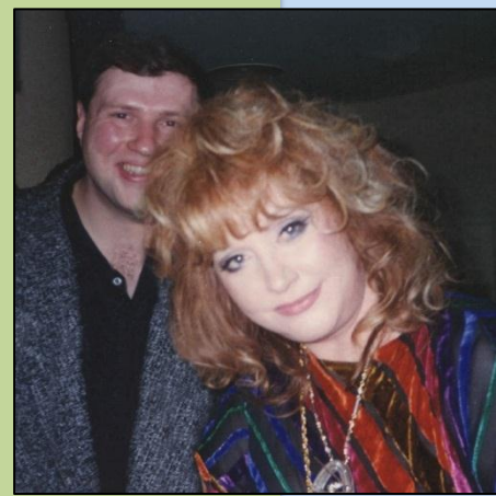
С А. Пугачевой на концерте «Сюрприз для Аллы»